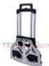
BOTON MANGO RETRACTIL