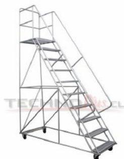
ETA - 250