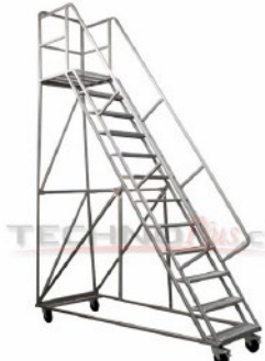
ETA - 300