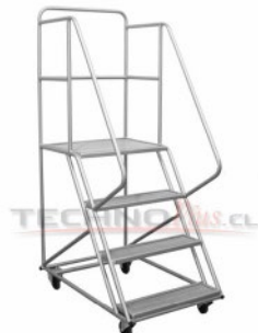
ETA - 100