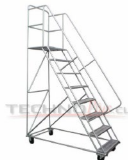
ETA - 200