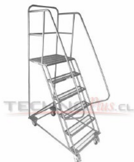
ETA - 150